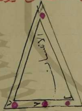
صورة المثلث على ما يرى في السماء ٥

قصد فنزل بهما ولا يلحق الشرطين وذلك غلط لانهما يكونان قدام الشرطين الى ان يقربان خط وسط السماء ثم يتاخرا عن الشرطين رويدا رويدا حتى اذا صار الى المغرب يغيبان بعد الشرطين فيجب ان يقال القمر ربما يسرع مجاوز الشرطين ونزل بالانيسين ٥ صورة المثلث على ما يرى في الكره ٥